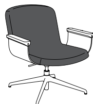
lamella křeslo una