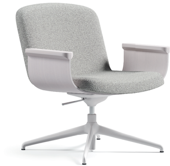
lamella křeslo una

autorem designu je přední česká designérka Lucie Koldova