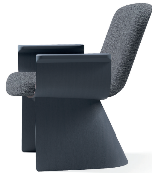
lamella křeslo cuatro