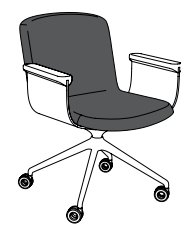
lamella una mobile